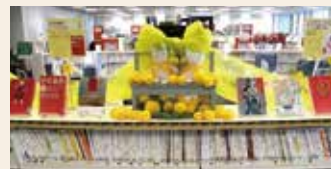
昨年の展示の様子(千代田図書館)