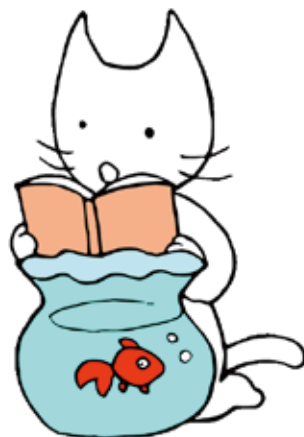
MIW マスコットキャラクター みゆうじろう