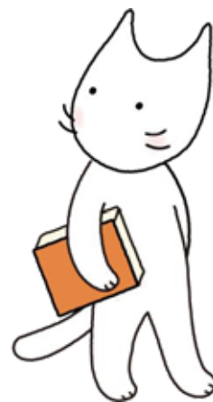
MIW マスコットキャラクター みゆうじろう