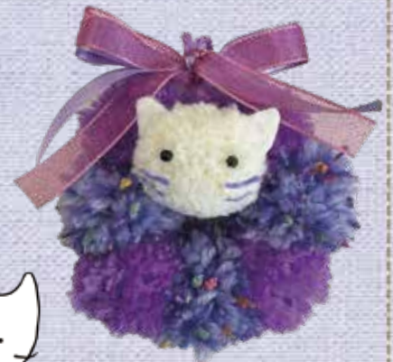
パープルリボンリース イメージ