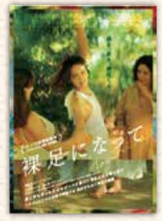
©THE INK CONNECTION - HIGH SEA - CIRTA FILMS - SCOPE PICTURES FRANCE 2 CINÉMA - LES PRODUCTIONS DU CHITIHI - SAME PLAYER, SOLAR ENTERTAINMENT