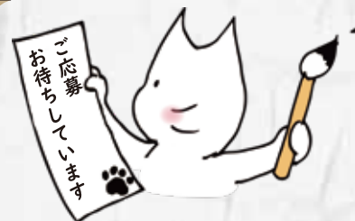
MIW マスコットキャラクター みゅうじろう