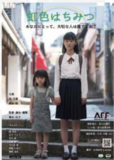
映画『虹色はちみつ』

映画と神田神保町が大好きな有志の方々が始めた、今や海外にも知られている東京神田神保町映画祭。女性監督のノミネート作品である映画『虹色はちみつ』(30分、2022年)上映と監督のトークのほか、映画祭実行委員会の取組みも紹介します。