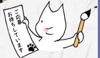
MIW マスコットキャラクター みゆうじろう

「女だから」「男のくせに」「家事シェア」「イクメン」… 日常で感じるもやもやを川柳で表現してみませんか? 応募作品から入選作を選び、MIW 祭りで表彰します!!